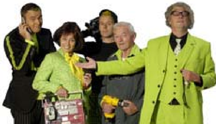
Studio F: skoaltelevyzje slút oan by nije metoade

Yn it neikommende haadstik wurkje wy de yntinsivearring fan ús yntegrale taalbelied per ûnderwiissektoar fierder út.